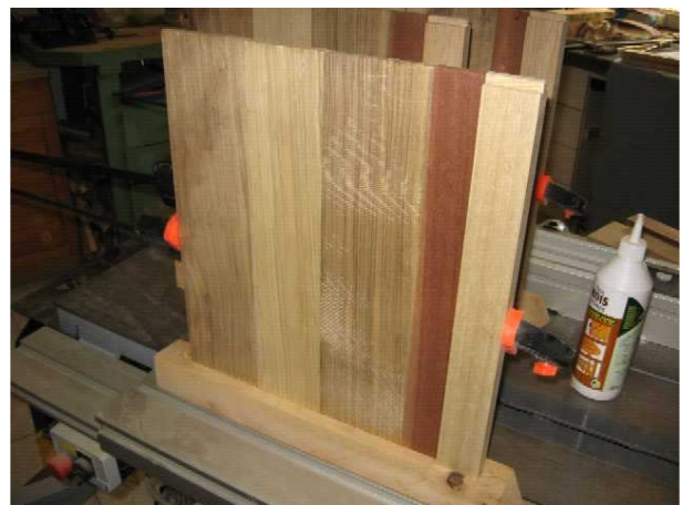
Photo prise lors du montage.

On peut si on le souhaite rajouter des poignées et/ou des roulettes, marier plusieurs couleurs ou essences de bois, Et voila !!!!!!!!!!!!!!!